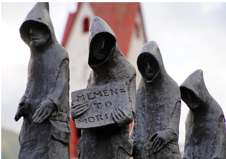
(Memento Mori – Skulptur fra Sydtyrol)

Vi vil begynde eftermiddagen med en kort introduktion i kristendommens forståelse af døden illustreret ved enkelte billeder. Herefter vil Kirsten Mandøe lede os igennem en meditation. Vi slutter med fordybende – evt. meditative - samtaler om, hvordan vi som moderne mennesker kan forholde os til netop den uundgåelige død.